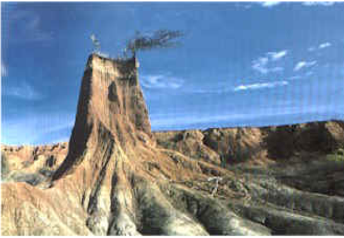
Desierto de la Tatacoa, Colombia.