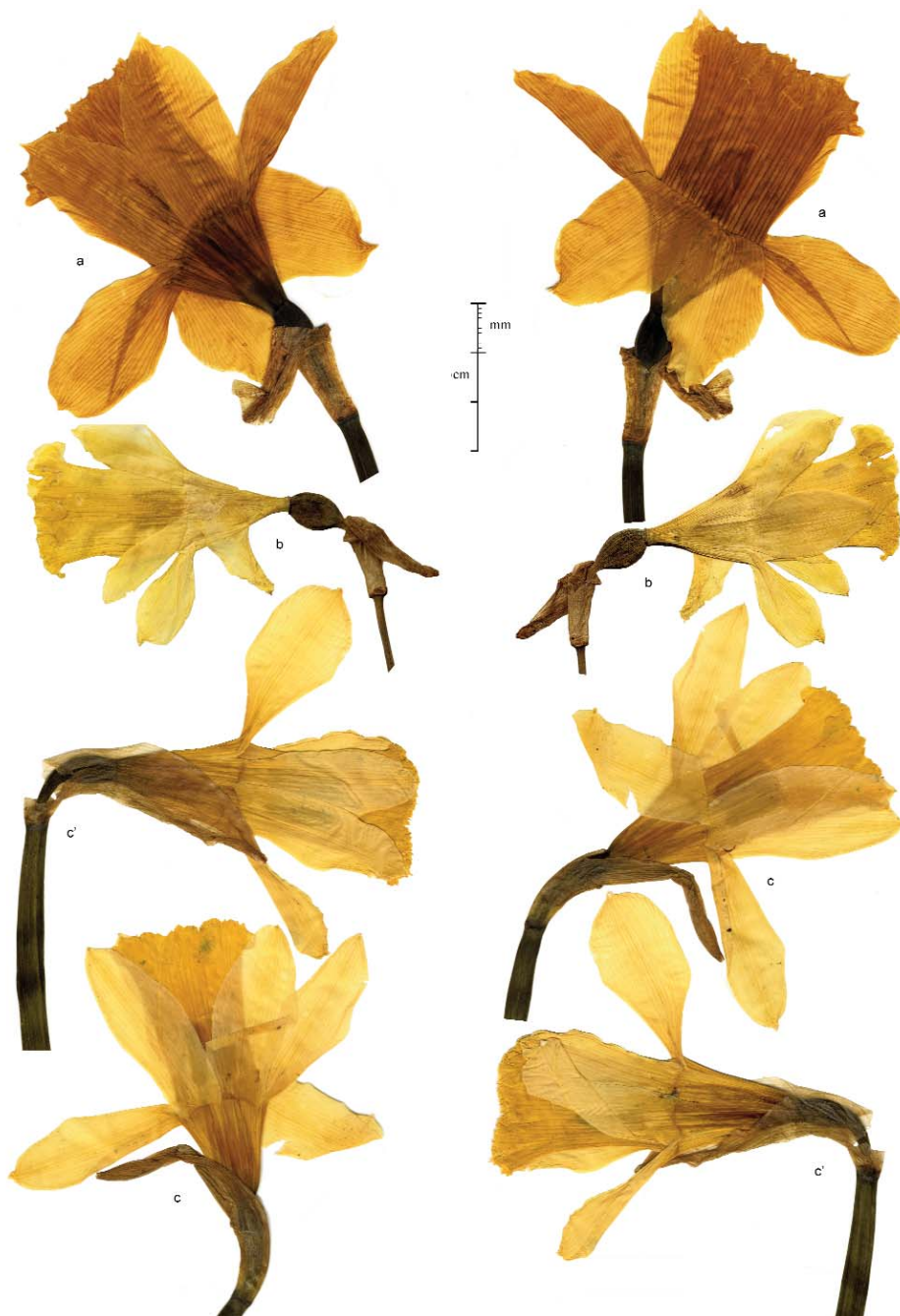
LÁMINA IV. a, c) Narcissus varduliensis Fdez. Casas & Uribe-Echebarría. b) N. xMikellii-Lordae Fdez. Casas. a) Uribe-Echevarría Díaz 438/88 (VIT 31623). b) Lorda López 14682 (VIT 76751, holotypus). c) Uribe-Echebarría Díaz, 24-IV-2005 (VIT 76442). Flores de pliego vistas por ambas caras.