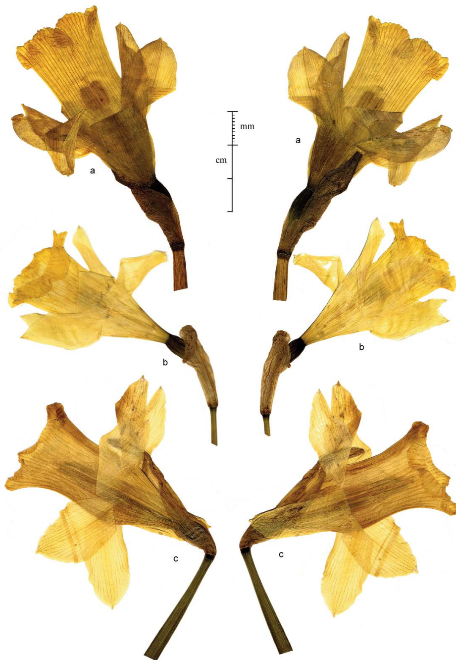
LÁMINA III. a, c) Narcissus varduliensis Fdez. Casas & Uribe-Echebarría. b) N. ×Mikelii-Lordæ Fdez. Casas. a) Uribe-Echevarría Díaz 1404/87 (VIT 31636). b) Lorda López 14682 (VIT 76751, holotypus). c) Aedo Pérez & al., 20-IV-1985 (VIT 76721). Flores de pliego vistas por ambas caras.