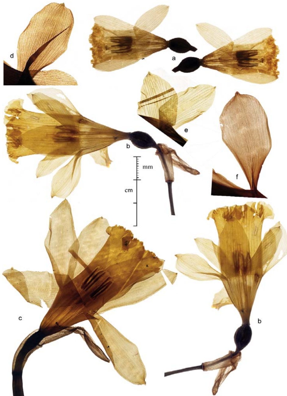
LÁMINA VI. Fotografías diascópicas en pliegos de herbario. a) Narcissus jacetanus Fdez. Casas; J. C. Báscones Carretero s/n, 19-II-1975 (PAMP 28079). b) N. xMikelii-Lordae Fdez. Casas; Lorda López 14682 (VIT 76751, holo-). c) N. varduliensis Fdez. Casas & Uribe-Echebarria. d) P. M. Uribe-Echevarria Díaz 438/88 (VIT 31623). e) C. Aedo Pérez & al., 20-IV-1985 (VIT 76721). f) P. M. Uribe-Echebarria Díaz s/n, 24-IV-2005 (VIT 76442). a, b) Flores vistas por ambas caras.