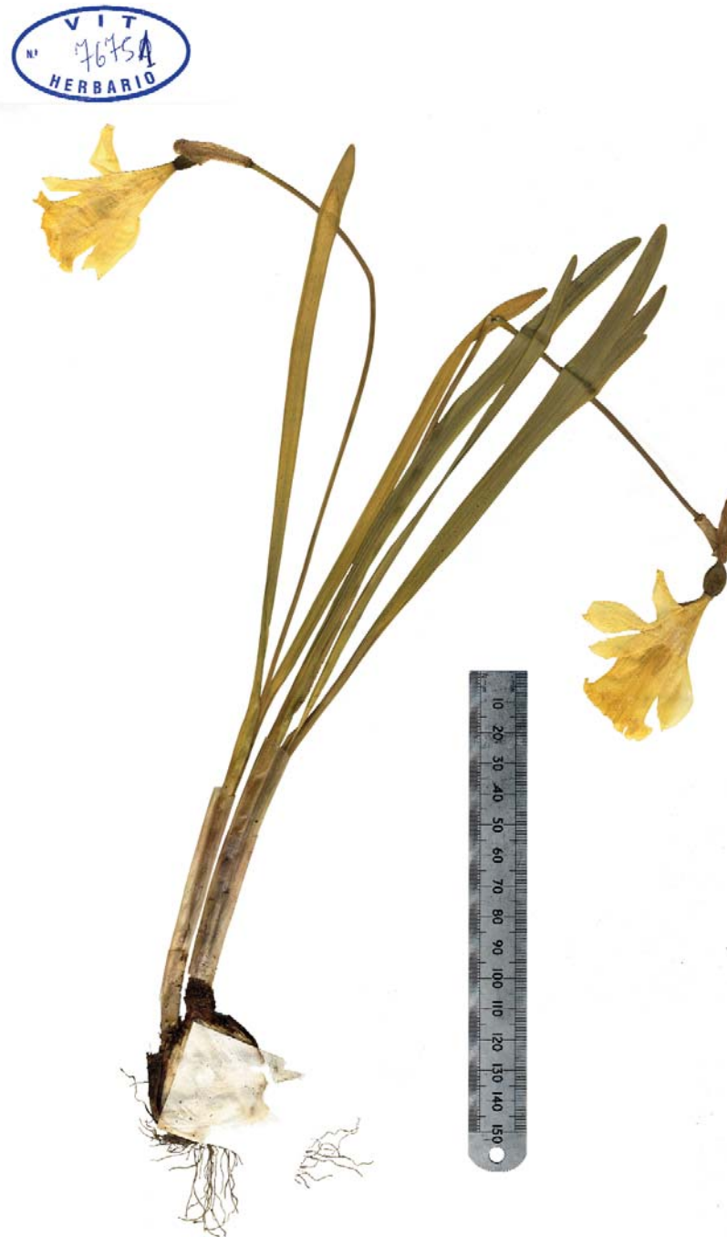
LÁMINA II. Narcissus xMikelii-Lordae Fdez. Casas (2014). Colección M. Lorda López 14682, 27-III-2005 (VIT 76751, holotypus). Es el mismo ejemplar de la lámina i, dado la vuelta.