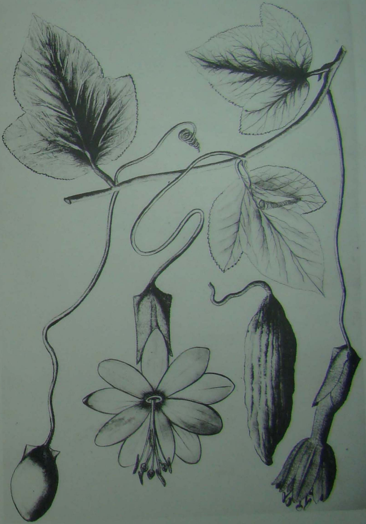
T. MARIAE SOD.