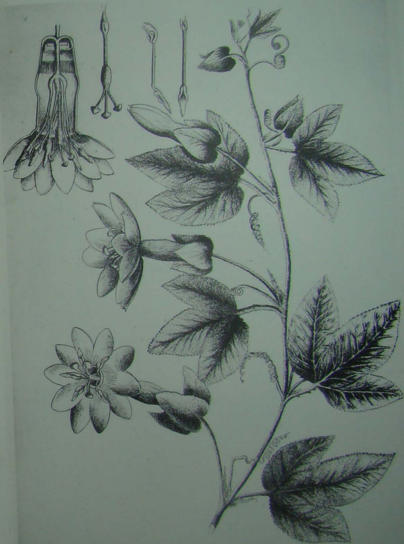
T. PINNATISTIPULA JUSS. X. T. ROSEA (KARST.) SOD.