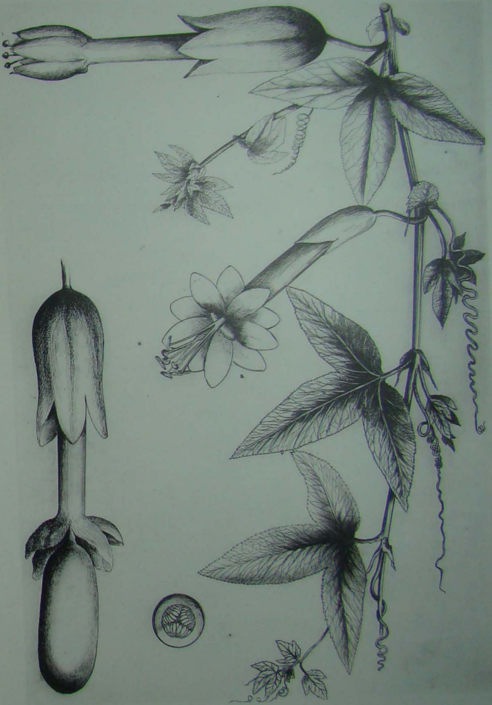
T. SPECIOSA H. B. K.