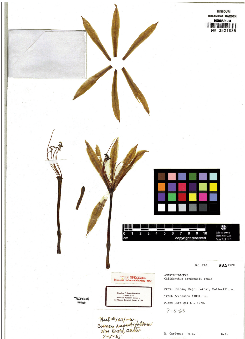
LÁMINA III. Pliego de Missouri (MO-Bot) con Crinum angustifolium , señalado como holótipo de Chlidanthus Cardenasii Traub. Los datos de la etiqueta no acaban de coincidir, y hay una revisión con fecha anterior a la de recolección de Cárdenas , fide figs. I y II. Tampoco concuerda con la descripción original, ni con la fotografía del protólogo, ni con el isótipo de BOLV 376. Obsérvese la localidad, Mollevillque que no Umabisa, y la fecha, 07-v-1965, que no XI-1968.