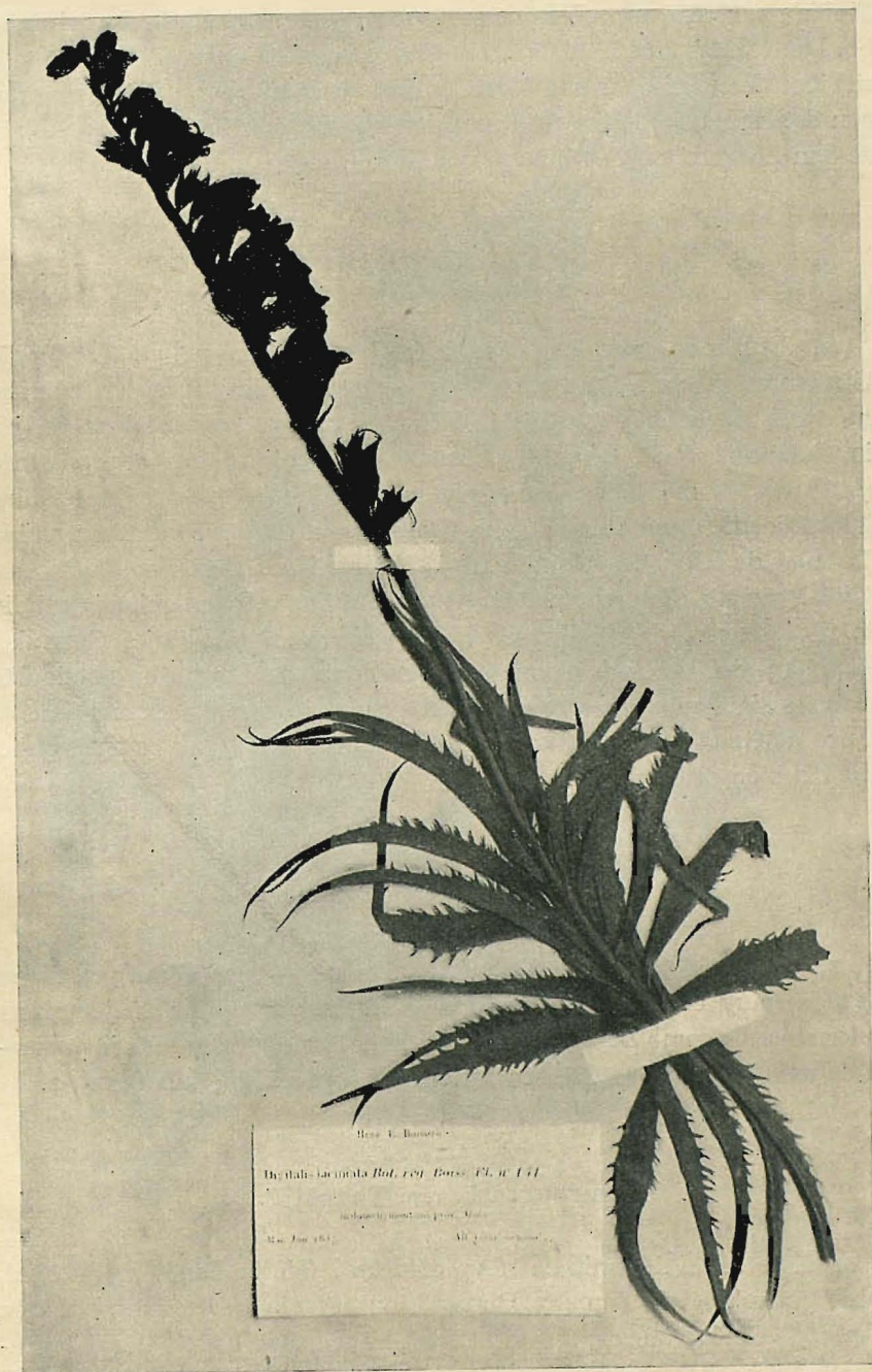
Fig. 1.—Ejemplar de D. obscura L. var. laciniata Pau, herborizado en Málaga por Boissier.