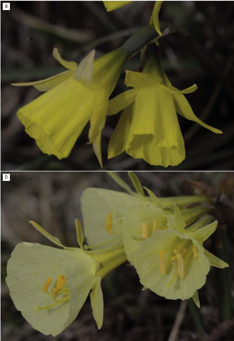
LÁMINA IV. a) Narcissus × picoeuropæanus Fernández Casas, colección tipo, F. J. Fernández Casas Ff_11-068. b) Parental adyacente, N. turgidus Salisbury, F. J. Fernández Casas Ff_11-066.