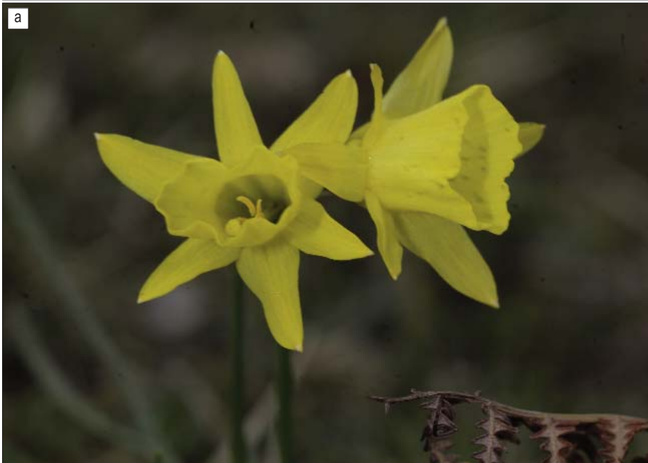
LÁMINA I. Narcissus × picoeuropæanus Fernández Casas, colección tipo, «(Cangas de Onís) Reserva Biológica de Munielles: supra lacum Enol», F. J. Fernández Casas Ff_11-068.