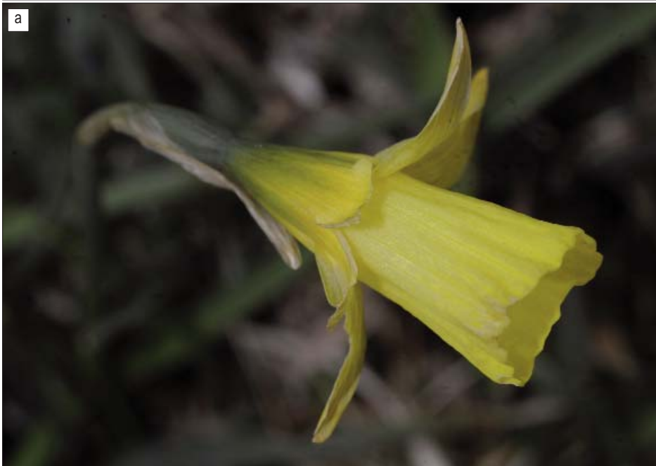
LÁMINA III. a) Narcissus × picoeuropæanus Fernández Casas, colección tipo, F. J. Fernández Casas Ff_11-068. b) Parental adyacente, N. turgidus Salisbury, F. J. Fernández Casas Ff_11-066.