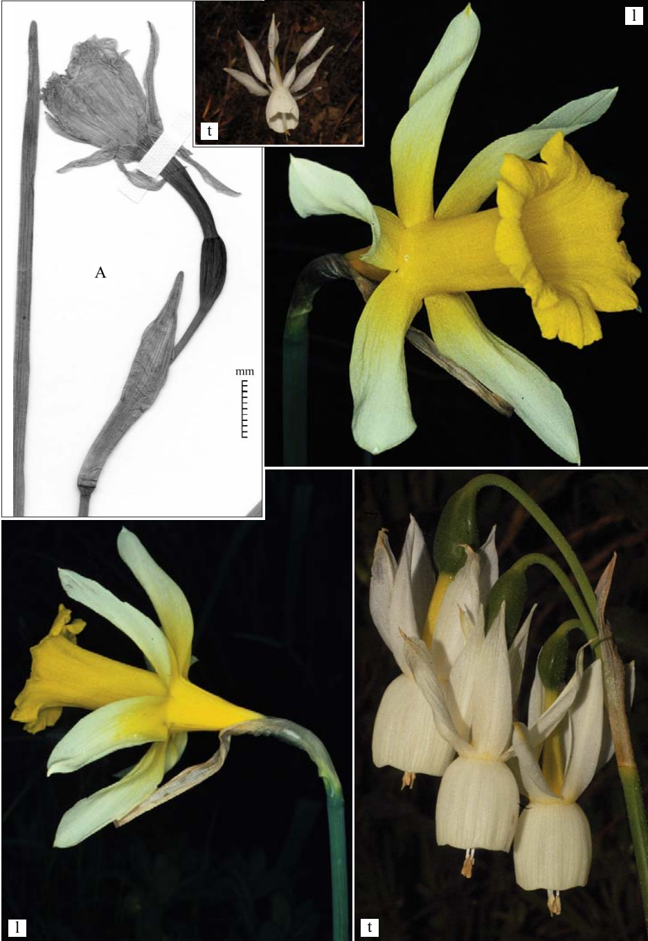
LÁMINA II. A) Narcissus × Aëdoi Fernández Casas, C. Aedo Pérez s/n (MA 611480, holo-), detalle. l) N. leonensis Pugsley, Fernández Casas 2855. t) N. triandrus Linnaeus, Fernández Casas Ff_07-027.