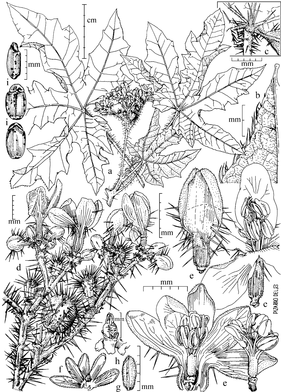
LÁMINA I. Cnidoscolus cajamarcensis Fdez. Casas. & Pizarro. J. Campos 2003 (MO 5294791, holótipo). a) Ramo fértil con hojas. b) Ápice foliar (envés). c) Gándulas acropeciolares. d) Inflorescencia con flores y frutos. e) Flores masculinas abiertas, botón y androceo. f) Flor femenina. g) Botón de flor femenina. h) Gineceo. i) Semillas, de arriba abajo en vista lateral, ventral y dorsal respectivamente.