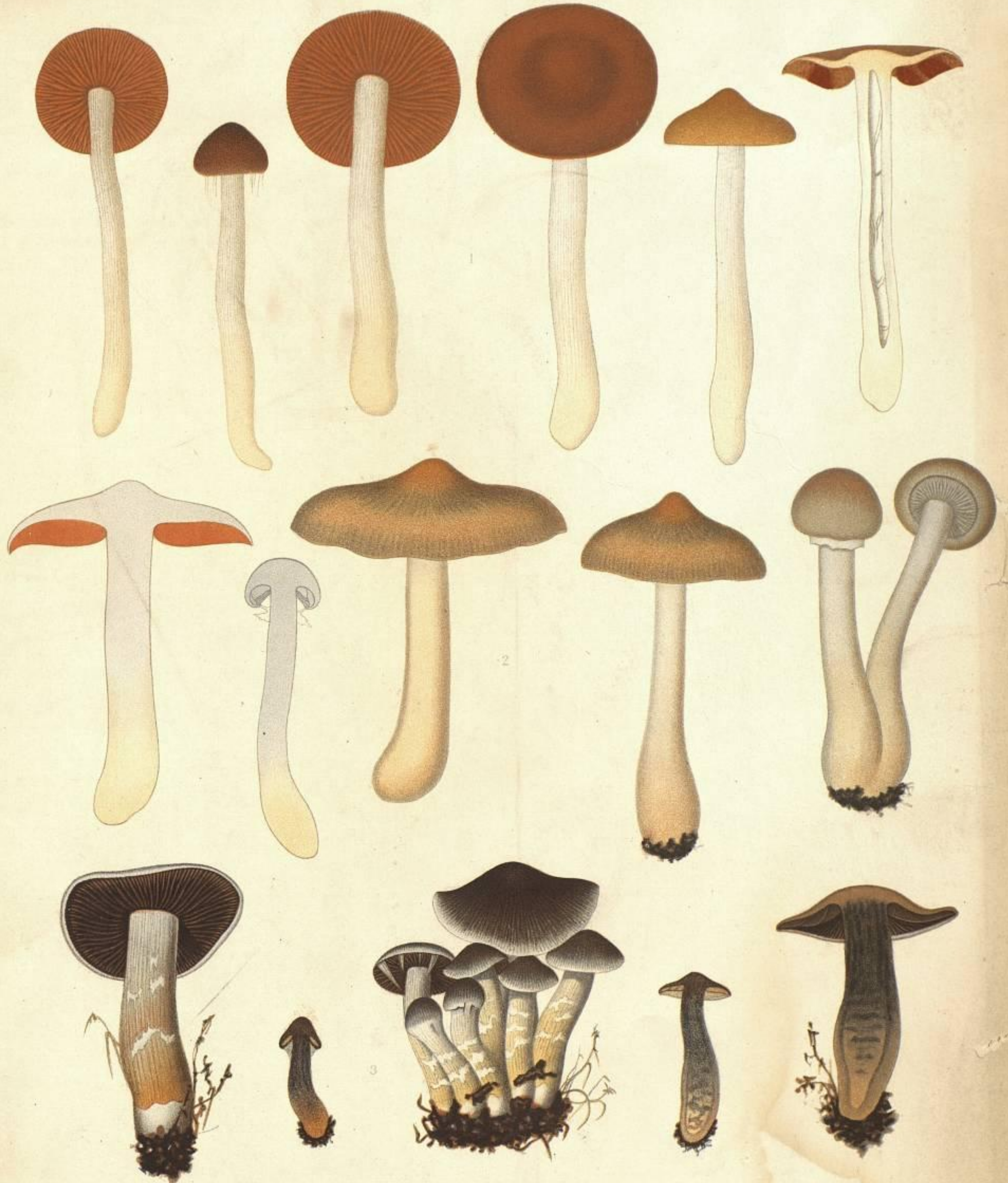
1. CORTINARIUS (HYDROCYBE) TORTUOSUS. FR. 2. CORTINARIUS (HYDROCYBE) SATURNIUS FR. 3. CORTINARIUS (HYDROCYBE) SCIOPHYLLUS FR.