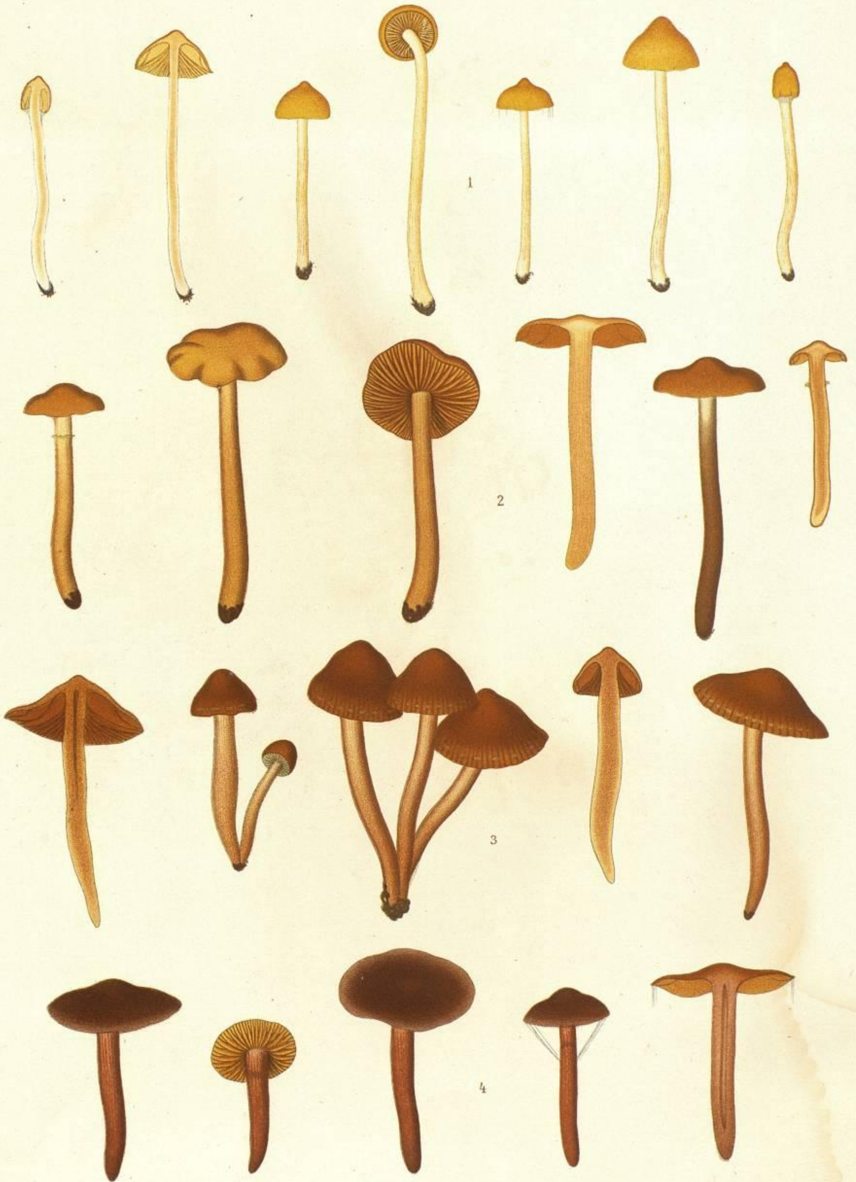
1. CORTINARIUS (HYDROCYBE) SCANDENS. FR. 2. CORTINARIUS (HYDROCYBE) SANIOSUS. FR. 3. CORTINARIUS (HYDROCYBE) OBTUSUS. FR. 4. CORTINARIUS (HYDROCYBE) DEPRESSUS. FR.