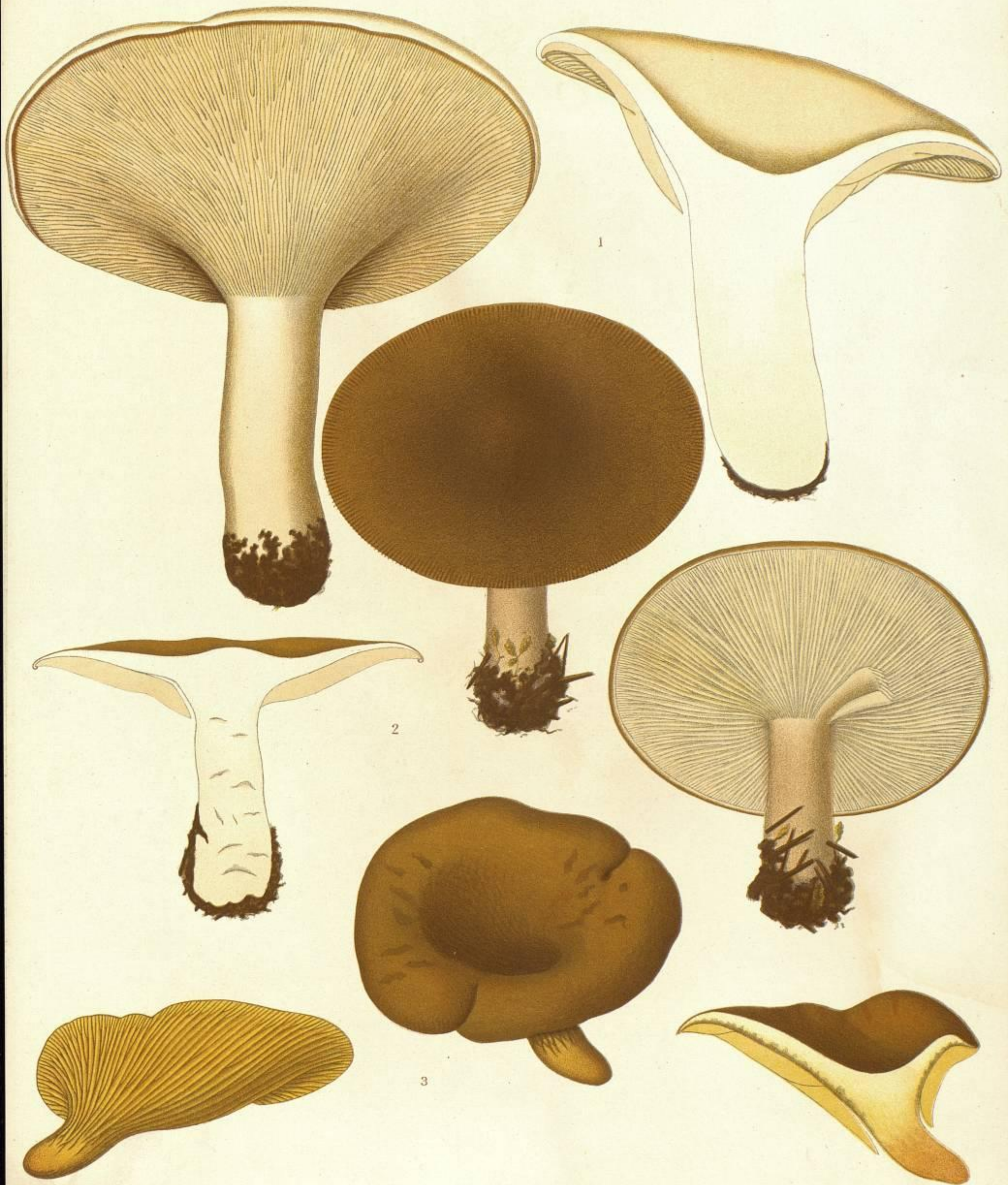
1. PAXILLUS LEPISTA FR. 2. PAXILLUS EXTENUATUS (SCOP.)