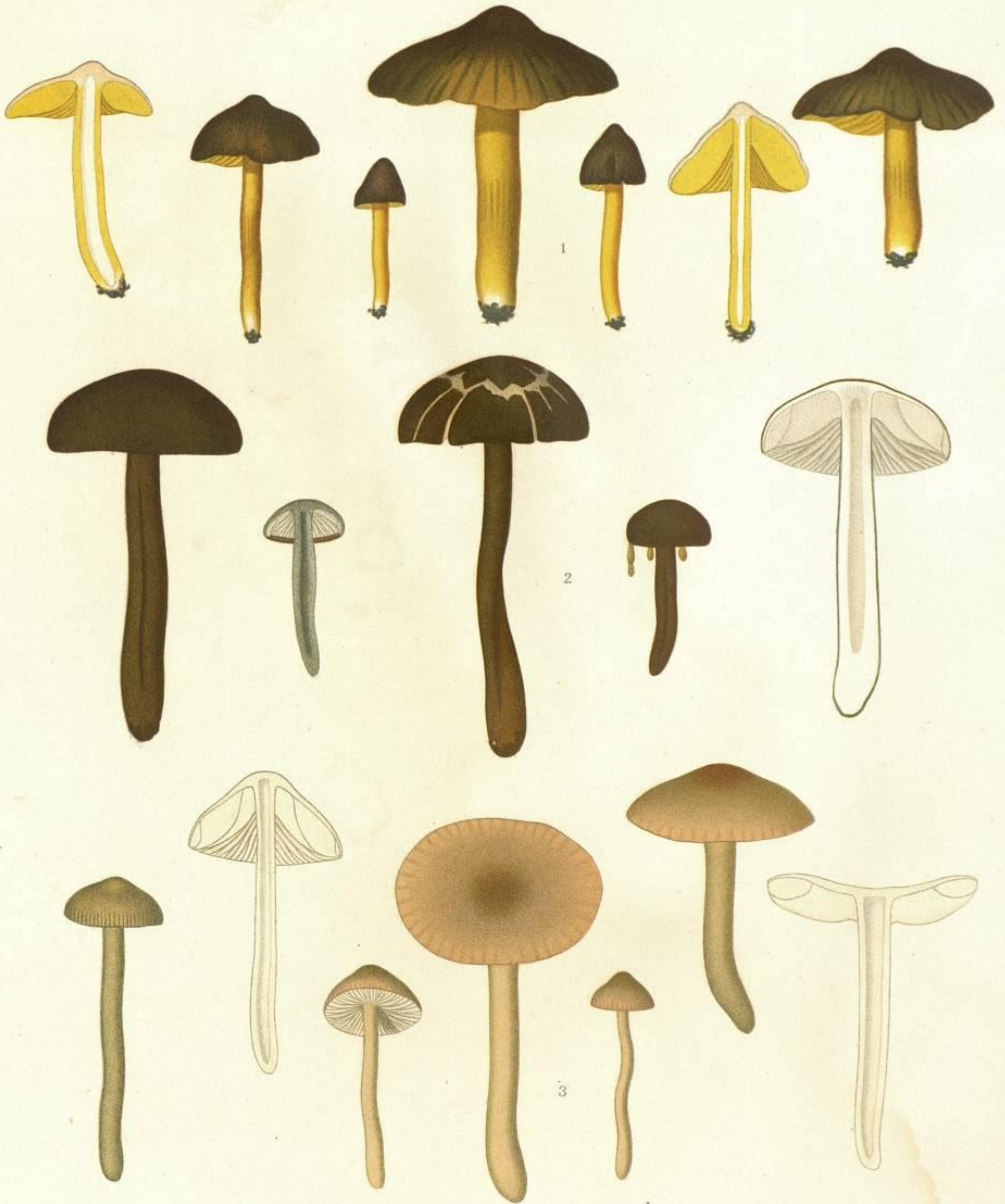
1. HYGROPHORUS (HYGROCYBE) SPADICEUS. FR. 2. HYGROPHORUS (HYGROCYBE) UNGUINOSUS. FR. 3. HYGROPHORUS (CAMAROPHYLLUS) IRRIGATUS. P.