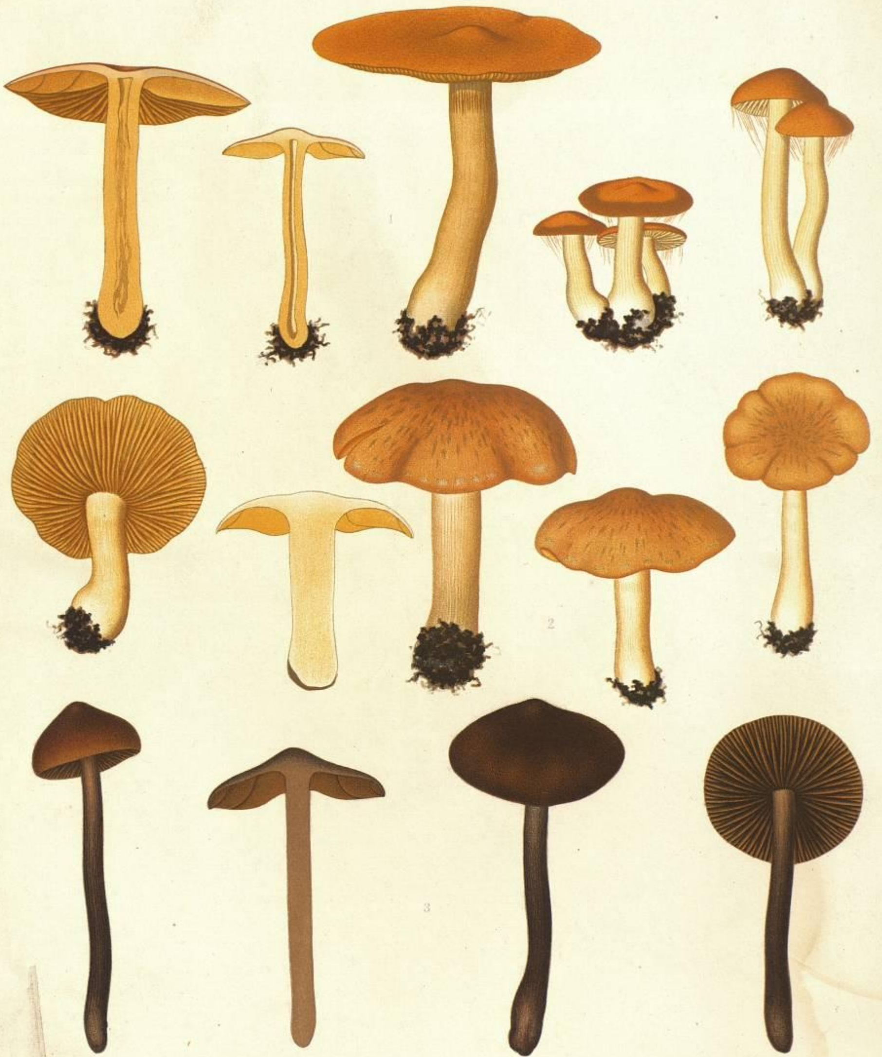
1. CORTINARIUS (HYDROCYBE) RENIDENS. FR. 2. CORTINARIUS (HYDROCYBE) ANGULOSUS FR.