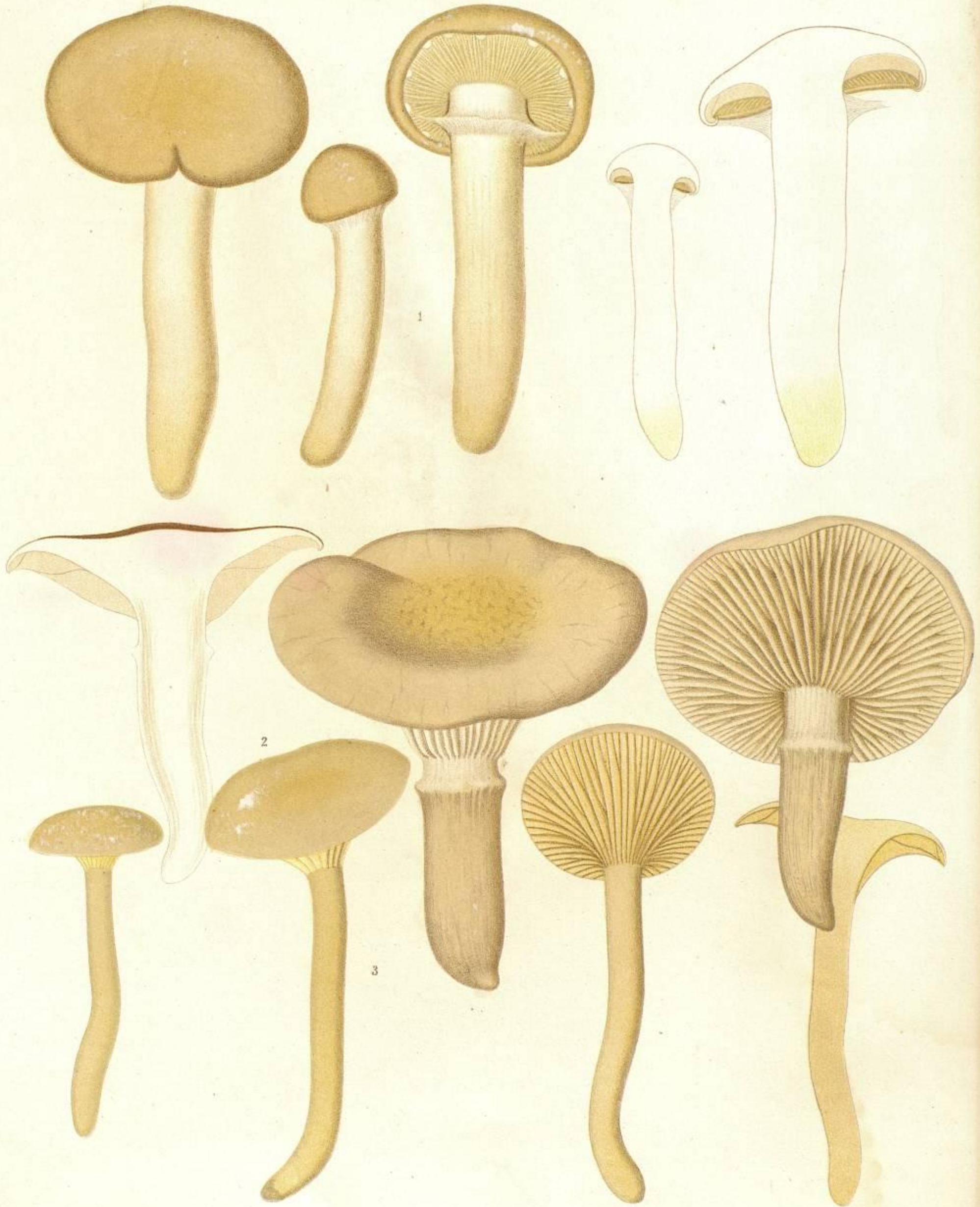
1 HYGROPHORUS (LIMACIUM) LIGATUS. FR. 2 HYGROPHORUS (LIMACIUM) GLIOCYCLUS. FR.