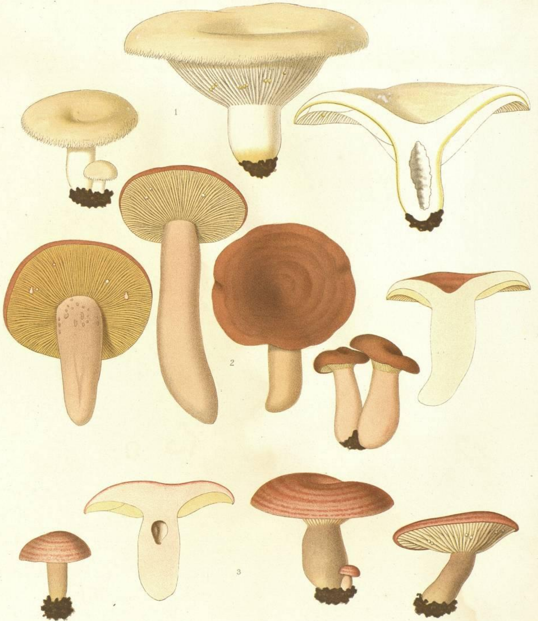
1. LACTARIUS RESIMUS. FR. 2. LACTARIUS HYGGINUS. FR. 3. LACTARIUS FLEXUOSUS * ROSEOZONATUS. v.P