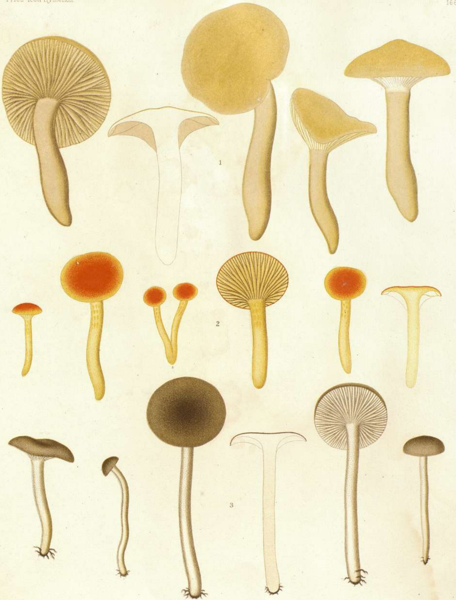
1. HYGROPHORUS (LIMACIUM) NITIDUS. FR. 2. HYGROPHORUS (LIMACIUM) AUREUS. ARRH. 3. HYGROPHORUS (LIMACIUM) PUSTULATUS. FR.