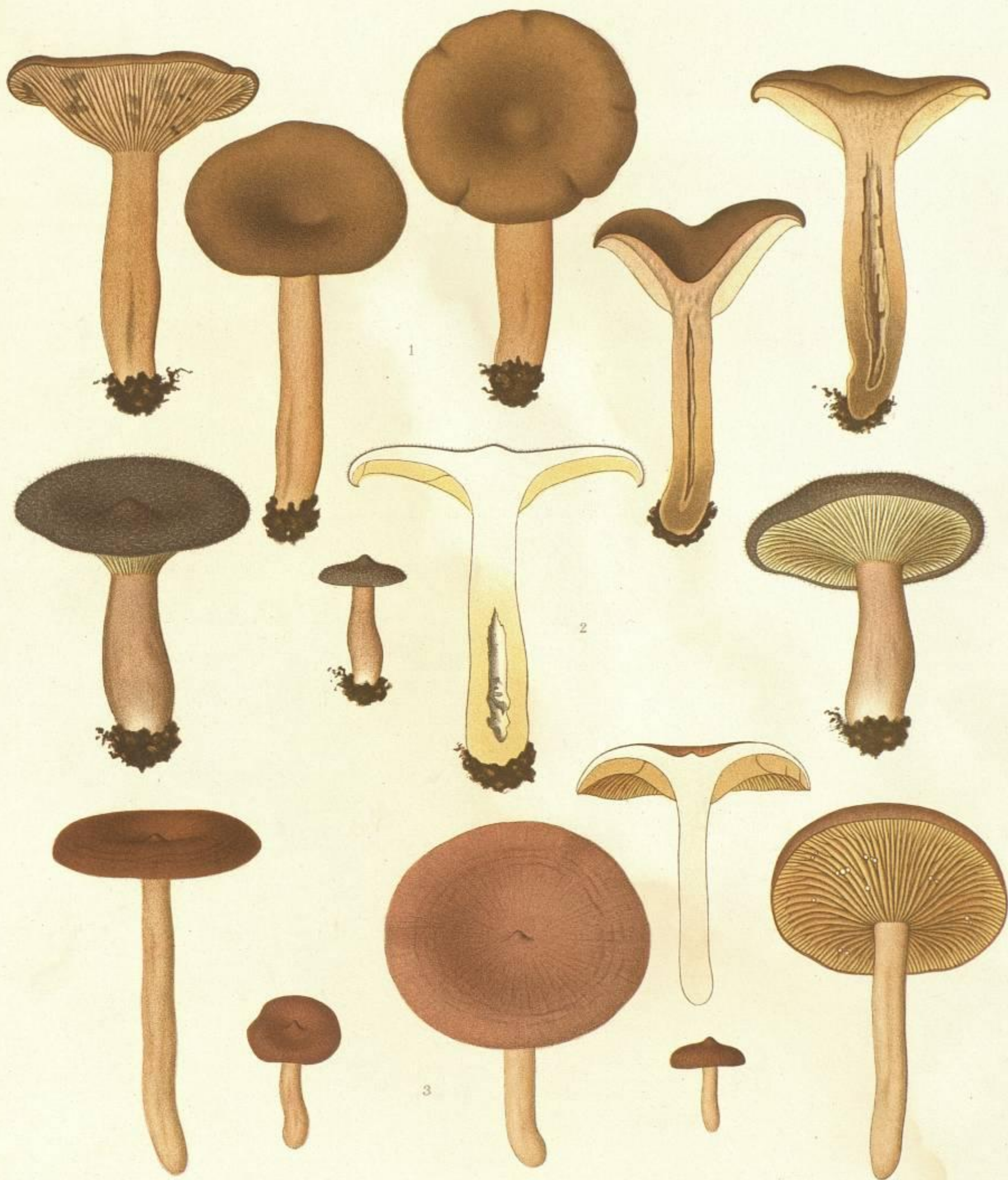
1. LACTARIUS VIETUS. FR. 2. LACTARIUS MAMMOSUS. FR. 3. LACTARIUS GLYCIOSMUS. FR.